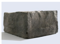
776 / MIX TIROL